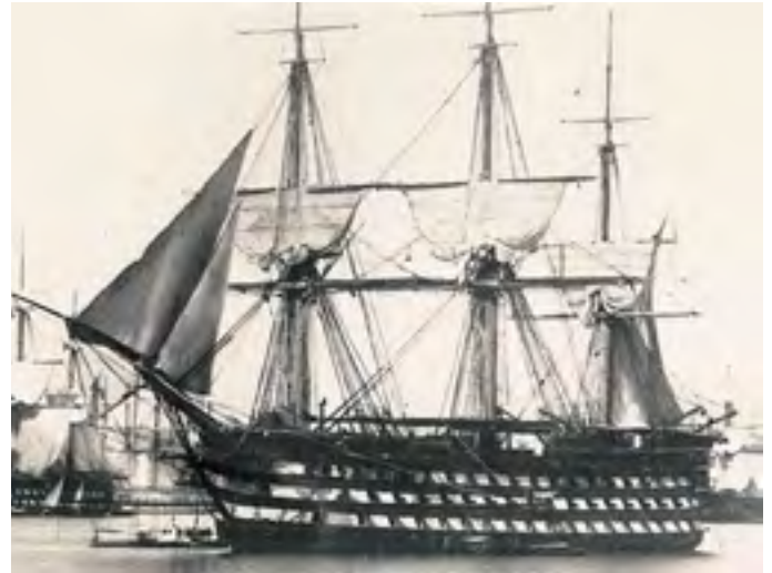
Le vaisseau de 118 canons MONTEBELLO à bord duquel moururent du choléra 3 jeunes Locquirecois en 1854

Et pourtant, cette guerre de Crimée est oubliée. Son souvenir a été effacé par celui de la désastreuse guerre de 1870 contre les états allemands conduits par la Prusse, guerre qui, pour Locquirec, semble avoir été beaucoup moins meurtrière.