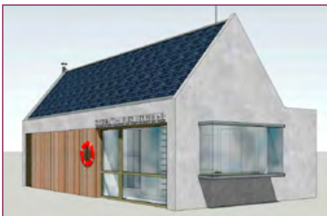
Le futur poste

La saison qui commence est chargée d'incertitudes. Souhaitons qu'elle apporte à tous, dans le respect des consignes sanitaires, de belles heures de navigation. Prenons soin de nous !