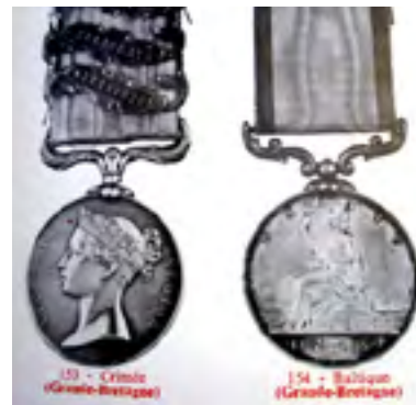
Medailles de Crimée et de la Baltique