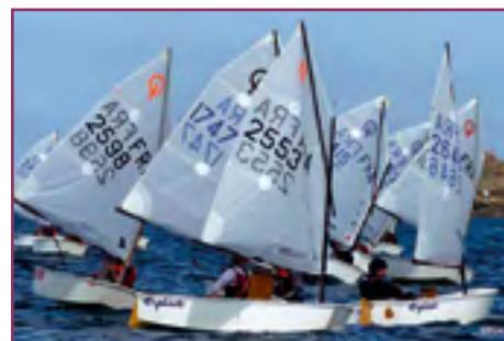
Les régates d'Optimists sont toujours très spectaculaires.