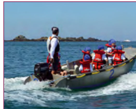
Le stage de découverte du milieu marin, et sa « fameuse » chasse au trésor, a toujours du succès auprès des « P'tits Moussaillons ».