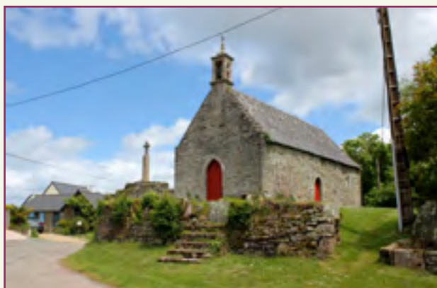
La chapelle de Linguez

Estelle FORGET pour la Commission Patrimoine