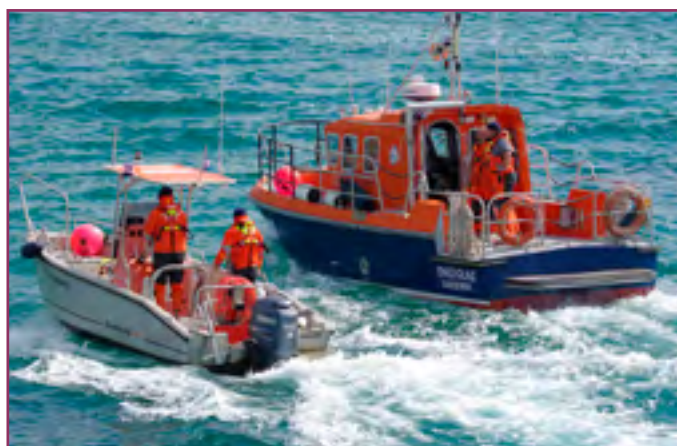
Enez & Gouliat